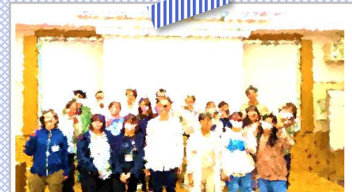
経験豊富で個性あふれる沢山のスタッフが皆さんと一緒に2日間過ごします