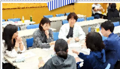
広々とした会議室でグループに分かれて楽しくワークしながら知識を深めます