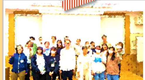
経験豊富で個性あふれる沢山のスタッフが皆さんと一緒に2日間過ごします