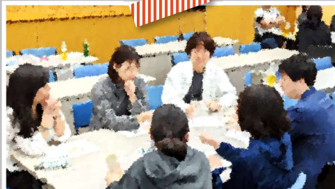
広々とした会議室でグループに分かれて楽しくワークしながら知識を深めます