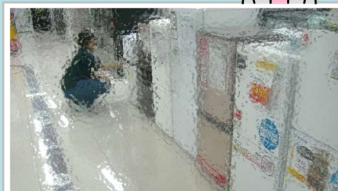
フィールドワークでは、実際に家電量販店 を皆で訪問して値段を調べます。