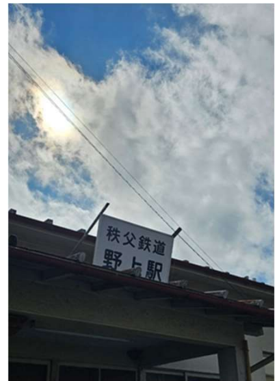
会場「長瀬げんきプラザ」の 最寄駅秩父鉄道「野上駅」