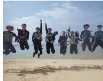
沖縄の海でアクティビティ

名称 一般財団法人教育支援グローバル基金 住所 〒150-0041 東京都渋谷区松濤1-26-18園ビルディング1F 電話番号 03-5453-8030 ファックス 03-6745-9100 電子メール info@beyond-tomorrow.org ウェブサイト https://beyond-tomorrow.org/