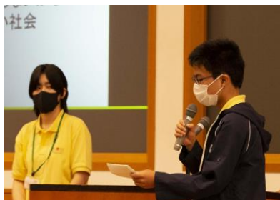
自分達の考えをプレゼンテーション