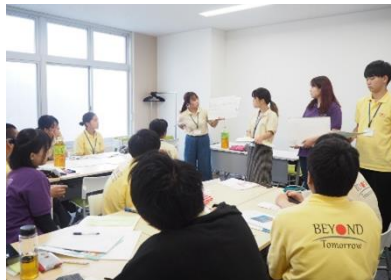
仲間とのディスカッション