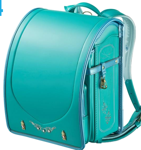
エメラルドオーシャン