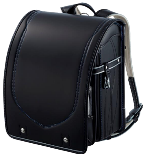
ブラック×マリンブルー