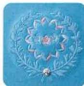
サイドの刺しゅうと スワロフスキー

繊細な刺しゅうと上品なパールカラー。 フォーマルな北欧風のデザインで大人っぽく。