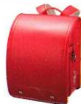
キャンディピンク