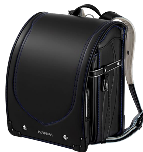
ブラック×マリンブルー