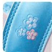
肩ベルトの 花柄刺しゅう