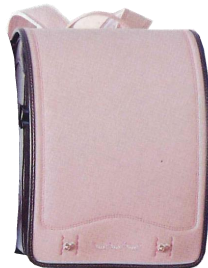
アプリコットココア