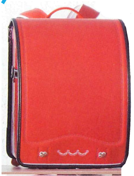
フュリボンココア