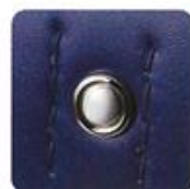
シンプルな飾り鉤