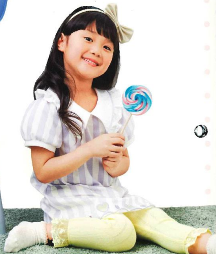
パステルパープル