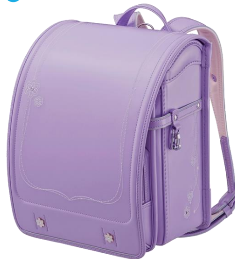
パステルパープル