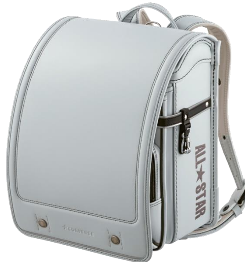
マニッシュグレー