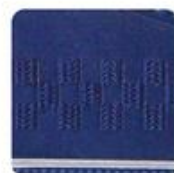
サイドの市松模様