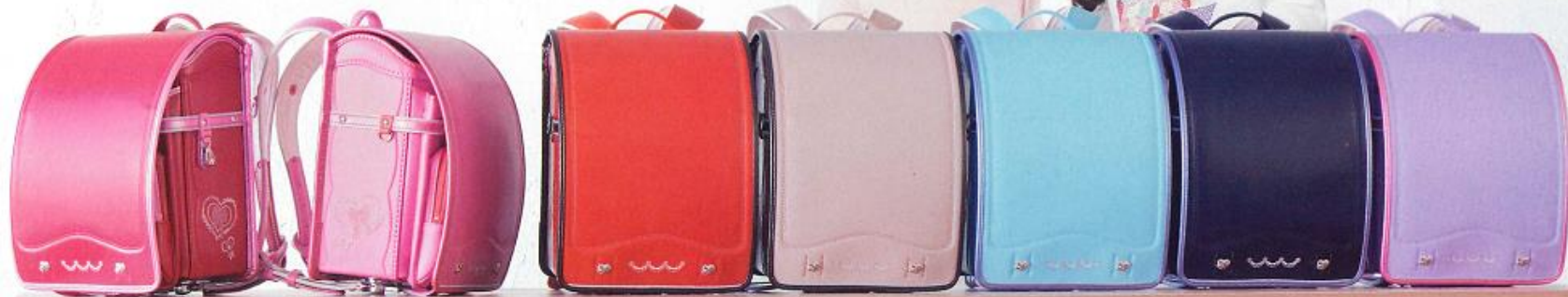
キャンディパール