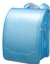
クリスタルアクア