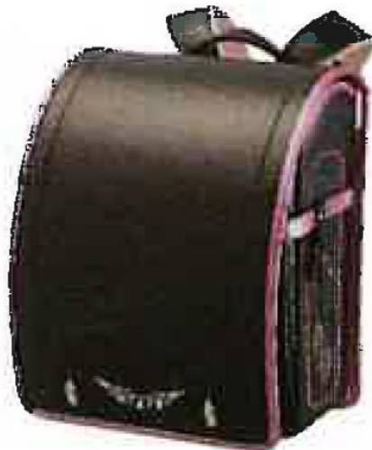
ブラウンチュール