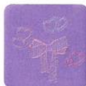
サイドの ハート刺しゅう