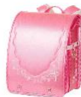
ダイヤモンドビーチ