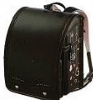
ミルキーブラウン