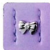
リボン型の飾り紙