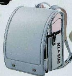
マニッシュグレー