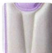
通気性の良い 背裏構造