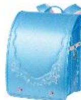
クリスタルアクア