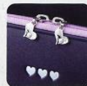
ポケットのチャーム