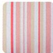
ストライプ柄の カブセ裏