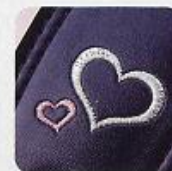
肩ベルトの ハート刺しゅう