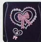
サイドのハート 刺しゅう