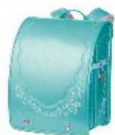
♥エメラルドパール