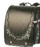
グロッシープラウン