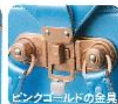
ピンクゴールドの金具