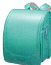
★ エメラルドパール