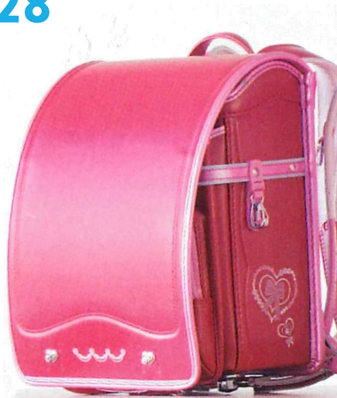
キャンディパール