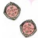
パールのおまじない シカガミ・レモニカ、パール

単色中にキラキラと輝くパールのアクセント。女の子らしいかわいらしいデザインが、おまじないの魔法です。