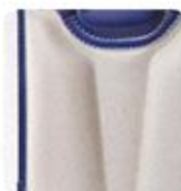
通気性の良い 背裏構造

シンプルかつ洗練されたスマートデザイン。 丈夫でツヤのある素材だからずっとキレイ。