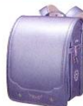
シャイニーバイオレット