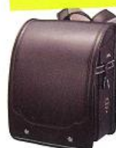
グロッシーブラウン