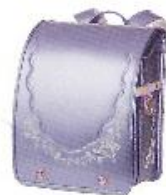
シャイニーバイオレット