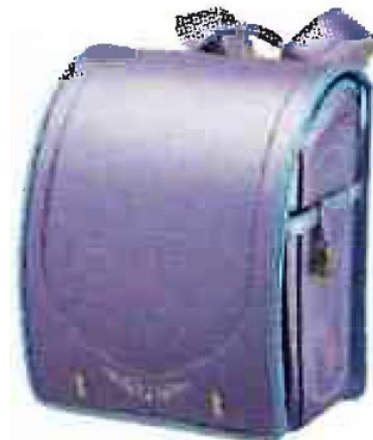
ビーナスヴィオーラ