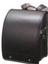
サムライブラック