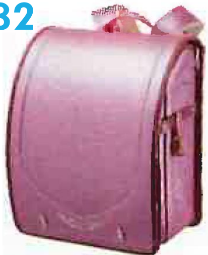
ハッピープレシャス