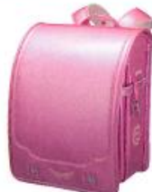
ダイヤモンドピーチ