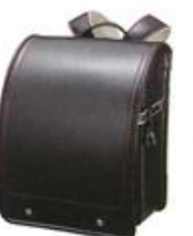
ファイヤーブラック